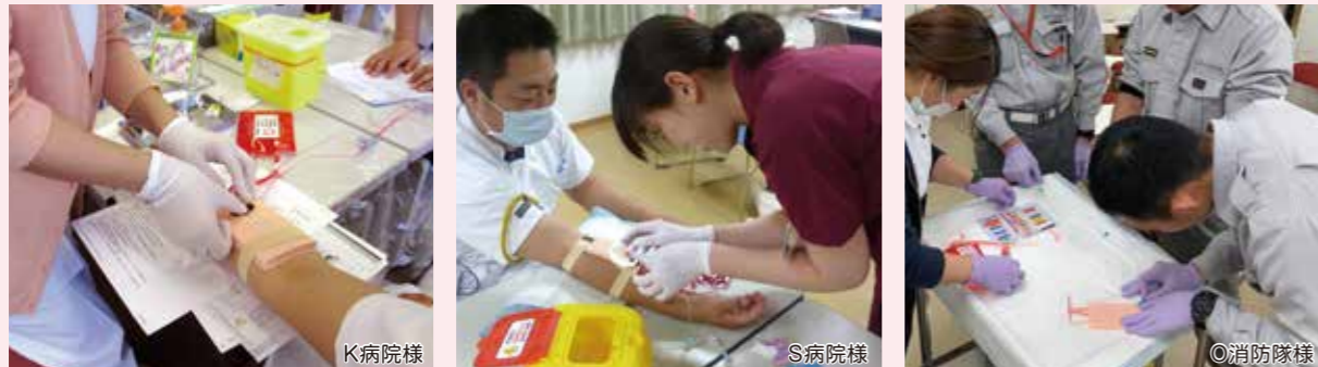
病院内での新人看護師トレーニングや救命救急士の訓練で実際に活用される様子。 (写真中の商品は開発中の試用時のものも含まれます)

これまでの培ったノウハウと多くの医師、看護師、救命救急士の皆さまの声を活かして開発しています